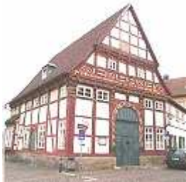
Stadtbücherei: Anno 1554