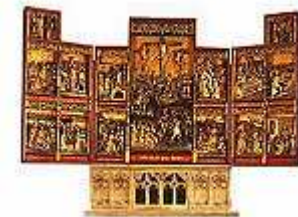
Prunkstück der Stiftskirche ist der 1496 geweihte Flügelaltar.