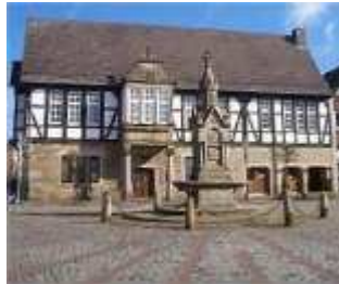
Ratskeller: Anno 1555