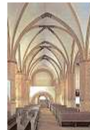
Stiftskirche (St. Marien) Innenansicht